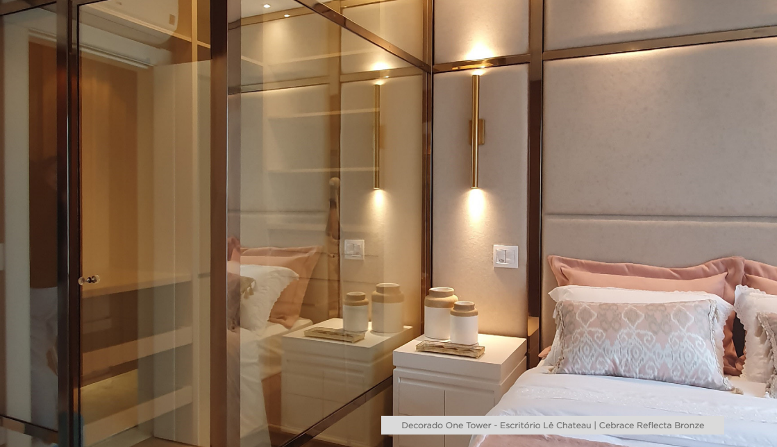
Decorado One Tower - Escritório Lê Chateau | Cebrace Reflecta Bronze