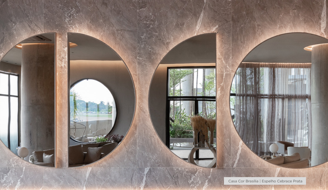
Casa Cor Brasília | Espelho Cebrace Prata