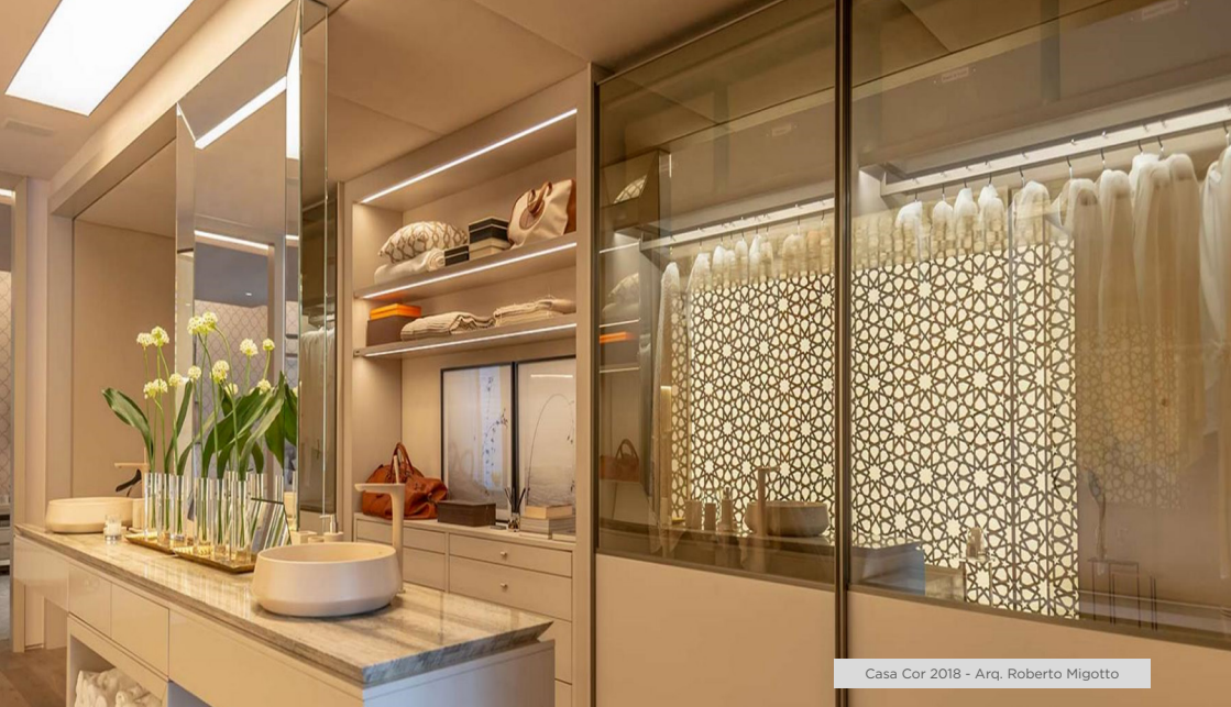
Casa Cor 2018 - Arq. Roberto Migotto